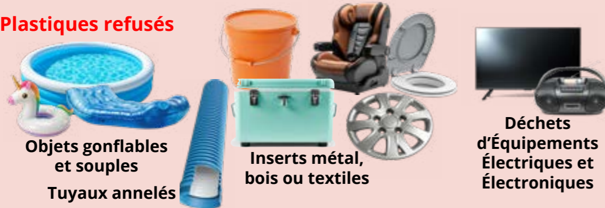
Objets gonflables et souples Tuyaux annelés