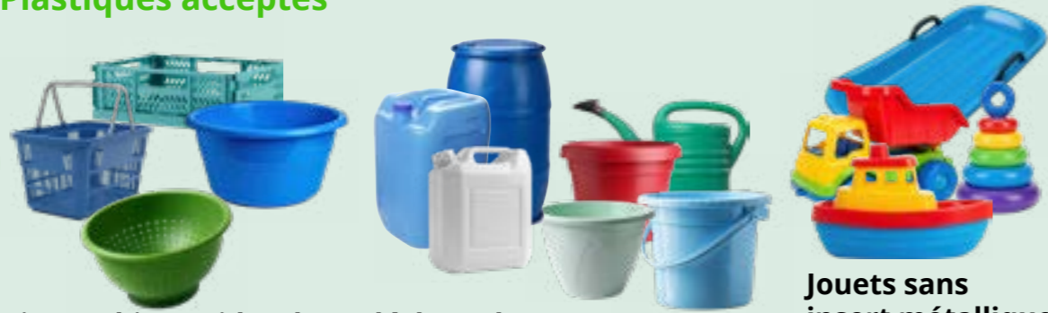
Divers objets, vides (hors déchets dangereux)