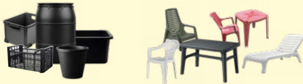
Objets en plastique sombre